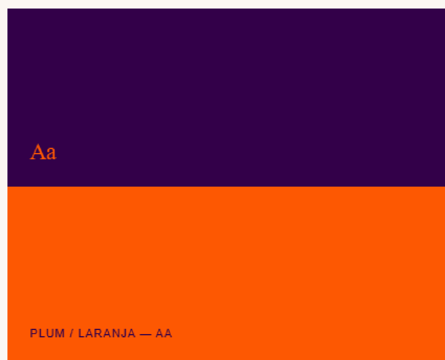
PLUM / LARANJA — AA